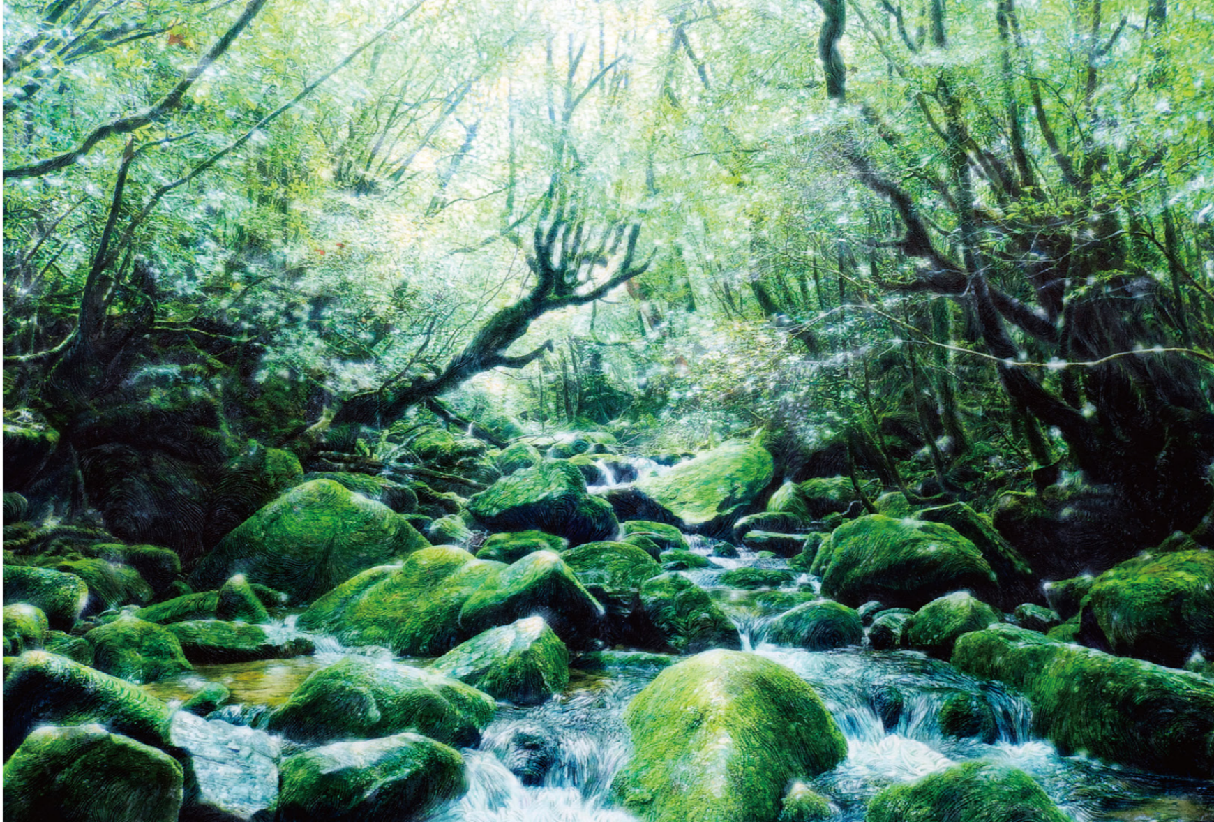
“The Silent Drama -Yakushima #13-” Mixed media, H57 x W85cm, 2016